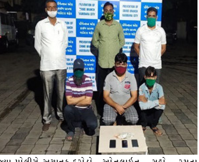
જ્યા પોલીસે અચાનક દરોડો પાડી સઢોડિયાઓને ચોંકાવી દીધા હતા. અહી ત્રણ શખ્સ

વડોદરા, કોરોનાનાં કહેર વચ્ચે લોકોને એક મુશી ઇપી શરૂ થયા બાદ થઈ હોય તેવું તમે ઘણી જગ્યાએ સાંભળ્યું હશે. જોકે ઇપી ક્રિકેટ ટૂર્નામેન્ટ શરૂ થયા બાદ સઢોડિયાઓ પણ સક્રિયા થઈ ગયા છે. મળી રહેલા સમાચાર મુજબ વડોદરામાં ઇપી ની મેચ પર સઢો રમતા અમુક નબીરાઓ પોલીસનાં હથેય ચઢ્યા છે.