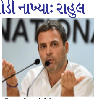
ચીન સાથેના સંબંધોના મજબૂત થવા પર હતા.

ન્યુ દિલ્હી, કોંગ્રેસના પૂર્વ અધ્યક્ષ અને વાયનાડના સાંસદ રાહુલ ગાંધી દેશમાં પરત ફરી ચૂક્યા છે. તેઓ પોતાની માતા સોનિયા ગાંધીની સારવાર માટે તેમની સાથે વિદેશ ગયા હતા. આ દરમિયાન રાહુલ ગાંધી સોશિયલ મીડિયા દ્વારા લોકો સાથે સંકળાયેલા હતા. તેઓ અવારનવાર ટ્વિટર દ્વારા મોદી સરકાર પર પ્રહાર સાધતા રહ્યા છે. થોડા સમય અગાઉ તેમણે સરકાર પર આંતરરાષ્ટ્રીય સંબંધો મામલે પ્રશ્ન કરતા પ્રહાર કર્યો છે. રાહુલ ગાંધીએ ટ્વિટ કરીને કહ્યું કે, મિસ્ટર મોદીએ સંબંધોના એ જાળાને નષ્ટ કરી દીધો છે, જે સંબંધોને કોંગ્રેસે કેટલાય દશકાઓ સુધી મહેનત કરીને બનાવ્યો હતો. પડોશમાં મિત્રો વગર રહેવું ખતરનાક છે. રાહુલ ગાંધીએ એક અહેવાલનો ઉલ્લેખ કરતા આ ટ્વિટ કર્યું છે. આ અહેવાલ બાંગ્લાદેશના ભારત સાથેના સંબંધોના નબળા થવા અને