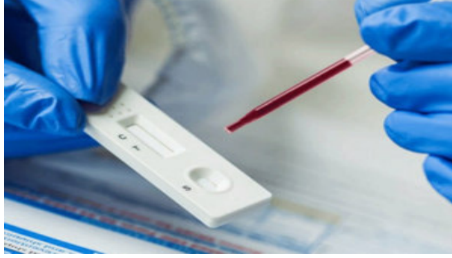
સંખ્યા ૫૬,૪૬,૦૧૦ સુધી પહોંચી ગઈ છે. દેશમાં સતત છેલ્લા પાંચ દિવસથી કોરોના વાયરસના સંક્રમણમાંથી સ્વસ્થ થનારા લોકોની સંખ્યા નવા નોંધાતા

ન્યુ દિલ્હી, ભારતમાં કોરોના વાયરસનું સંક્રમણ પૂર ઝડપે ફેલાઈ રહ્યું છે. સમગ્ર વિશ્વમાં કોરોના વાયરસના સોથી વધારે કેસ ધરાવતા દેશોની યાદીમાં ભારત દેશ બ્રાઝીલને પાછળ છોડીને બીજા સ્થાન પર પહોંચી ગયો છે.