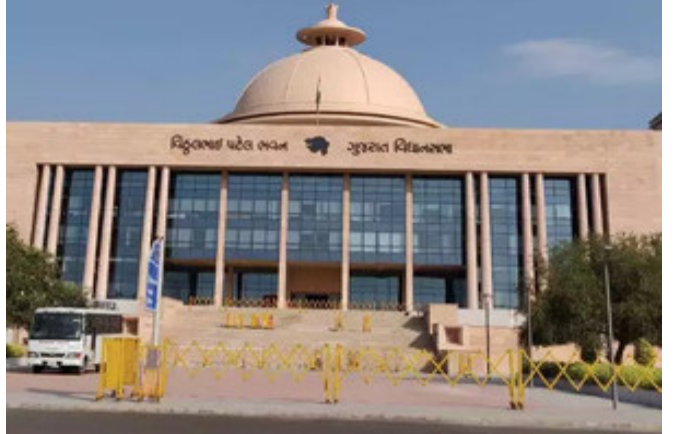
જોગવાઈઓ મુજબ ૧૦૦કે તેથી વધુ કામદાર ધરાવતી સંસ્થાએ કામદારોને લે-ઓફ, છટણી તથા

અમદાવાદ, વિધાનસભા ગૃહમાં રજૂ કરાયેલું ગુજરાત ઔદ્યોગિક તકરાર સુધારા વિધેયક પસાર કરવામાં આવ્યું છે. ઔદ્યોગિક તકરાર બિલમાં કામદારોને છટણી કરવાની થાય તો ૩ મહિનાની ચાલુ પગારની ફરજિયાત નોટિસ આપવી પડશે. ૩ મહિનાનો નોટિસ પગાર આપીને છૂટા કરી શકાશે નહીં. અગાઉ ગુજરાતમાં અમુક સંસ્થાઓમાં લે-ઓફ, છટણી અને ઔદ્યોગિક સંસ્થા બંધ કરવાને લગતી ખાસ જોગવાઈ હતી. તે અંતર્ગત કલમ ૨૫(ક)માં હાલની