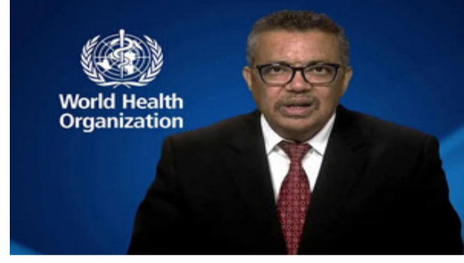
જિનિવા, કોરોના વાયરસથી છૂટકારો મેળવવા માટે દુનિયાભરના લોકો કોરોના રસીની આતુરતાથી રાહ જોઈ રહ્યા છે. પણ આ વચ્ચે વેક્સિનને લઈ વર્લ્ડ હેલ્થ ઓર્ગેનાઈઝેનેશન એક જટિલ આખો છે. WHOના પ્રમુખ ટ્રેડોસ અધનોમે એક નિવેદનમાં કહ્યું કે, કોવિડ ૧૯ માટે જે વેક્સિન પર કામ ચાલી રહ્યું છે, તેની કોઈ ગેરંટી લઈ શકાતી નથી કે તે કામ કરશે કે નહીં.

WHOના ચીફ એક્ઝિક્યુટિવ ઓફિસર ડૉ. ટેડ્રોસ અદહનોમે કહ્યું કે, અમે તેની કોઈ ગેરંટી નથી આપી શકતાં કે દુનિયાભરમાં જે વેક્સિન શકતાં કે દુનિયાભરમાં આવી રહી છે, તે વાસ્તવમાં કામ કરશે. અમે અનેક વેક્સિન કેન્ડિડેટ્સને ટેસ્ટ કરીએ છીએ. વધારે આશા એ છે કે, આપણને એક સુરક્ષિત અને પ્રભાવશાળી વેક્સિન મળી જશે. આગળ તેઓએ કહ્યું કે, અત્યારે લગભગ ૨૦૦ વેક્સિન ક્લિનિકલ અને પ્રી ક્લિનિકલ ટેસ્ટિંગમાં છે.