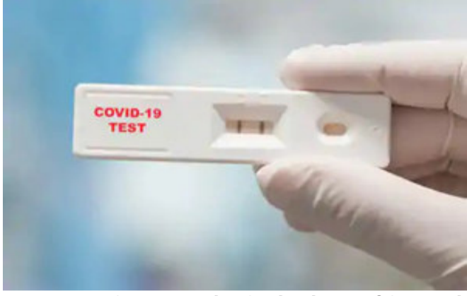
હતી. મુખ્યમંત્રી વિજય રૂપાણીએ રાજ્ય મંત્રી મંડળની બેઠકમાં આ વિષયે થયેલી ચર્ચા વિચારણાને અંતે ખાનગી લેબોરેટરીઓ સામે

રાજ્યવ્યાપી તપાસના આદેશ આરોગ્ય વિભાગને આપ્યા છે. આરોગ્ય વિભાગના અગ્ર સચિવ ડૉ. જયંતિ રવિએ આ અંગેની વધુ વિગતો આપતાં જણાવ્યું હતું કે, "યોગ્ય પરિક્ષણ વિના કોવિડ - ૧૯ના બોગસ ટેસ્ટ રિપોર્ટ આપતી ખાનગી લેબોરેટરીઓ સામે કડક કાર્યવાહી કરવાની સ્પષ્ટ સૂચના મુખ્યમંત્રી અને નાયબ મુખ્ય તરફથી આપવામાં આવી છે. મીડિયામાં આજે પ્રસિદ્ધ થયેલા અહેવાલોની રાજ્ય સરકારે