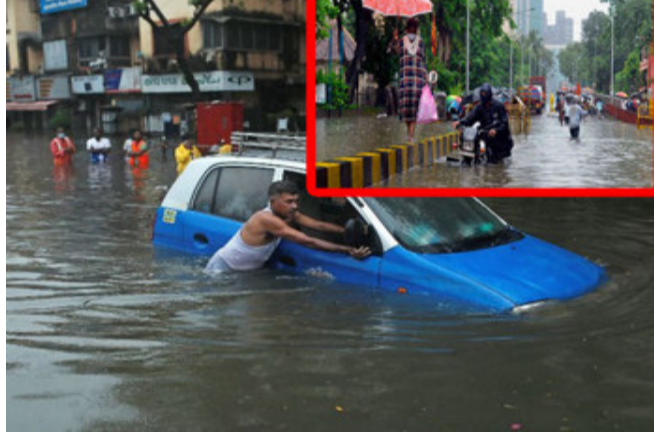
સાંતાક્રૂઝ વેધર સેન્ટરમાં ૨૭૩.૬ મીમી, જયારે દક્ષિણ મુંબઈનાં કોલાબા સેન્ટરમાં ૧૨૨.૨ મીમી વરસાદ નોંધાયો હતો.

મુંબઈ, મુંબઈમાં મોડીરાતથી પડી રહેલા ભારે વરસાદના પગલે અનેક વિસ્તારોમાં પાણી ભરાયા હોવાના અહેવાલ મળી રહ્યાં છે. ત્યારે અનેક લોકો રેલવે સ્ટેશન પર પણ ફસાયા છે.