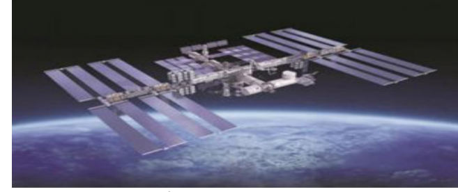
ન્યુ દિલ્હી/વોશિંગ્ટન, અમેરિકા સ્થિત ચાઈના એરોસ્પેસ સ્ટડીઝ ઈન્સ્ટિટ્યુટ નામની થિંક ટેક ટીમે કહ્યું છે કે, ભારતના સેટેલાઈટ કોમ્યુનિકેશન પર પણ ચીને ૨૦૧૭માં સાયબર એટેકનો પ્રયત્ન કર્યો હતો. આ ચોંકાવનારો ખુલાસો ત્યારે થયો છે જ્યારે સરહદ પર ભારત અને ચીન વચ્ચે ટકરાવની સ્થિતિ સર્જાયેલી છે. સીએએસઆઈનું કહેવું છે કે, ઇલ્લા ૧૩ વર્ષથી ભારત પણ ચીન દ્વારા સતત સાઈબર એટેક કરવામાં આવી રહ્યો છે. ઈસરોનું પણ માનવું છે કે, સેટેલાઈટ કોમ્યુનિકેશન સામે સાયબર એટેક મોટો ખતરો બની શકે છે. જોકે હજી સુધી હેડકંસના

પ્રયત્નો સફળ થયા નથી. સંસ્થાના ૧૪૨ પેજના રિપોર્ટમાં કહેવાયું છે કે, ૨૦૧૨ થી ૨૦૧૮ની વચ્ચે ચીને સંખ્યાબંધ વખત ભારતીય નેટવર્ક પર સાયબર એટેકને અંજામ આપવાની કોશિશ કરી હતી. ૨૦૧૨માં તો ભારતની જેટ પ્રપોલિશન લેબોરેટરી ચીનના નિશાના પર હતી. ચીન આ હુમલા થકી તેના નેટવર્ક પર કંટ્રોલ મેળવવાની કોશિશ કરી રહ્યું હતું. ભારતની સ્પેસ રિસર્ચ સંસ્થા ઈસરોનું કહેવું છે કે, ઈસરોના નેટવર્ક હેક કરવાના પ્રયાસો તો થયા છે પણ આ પ્રયાસો હજી સુધી સફળ થયા નથી. ઈસરો પાસે એવી સિસ્ટમ છે જે હેડકંસનો પ્રયાસ થાય કે તરત જ એલર્ટ આપી દે છે.