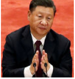
અમલીકરણ પર સહમત થયા.

પૂર્વ લદાખમાં ગતિરોધ ખતમ કરવાના હેતુથી બંને દેશોના સૈન્ય કમાન્ડરો વચ્ચે સોમવારે ૧૪ કલાક સુધી બેઠક ચાલી હતી. નિવેદનમાં કહેવાયું કે બંને પક્ષ પરસ્પર સંપર્ક મજબૂત કરવા અને ગેરસમજ તથા ખોટા નિર્ણયથી