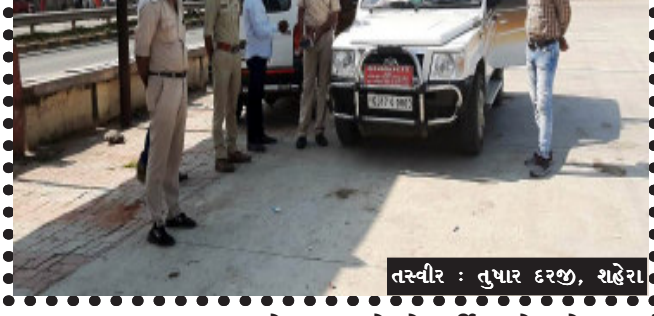
તસ્વીર : તુષાર દરજી, શહેરા

શહેરા, શહેરા એસ.ટી.બસ સ્ટેશનની અંદર ખાનગી વાહનો અને વીજ કંપનીના અધિકારીઓની હુસ્તિઓ બોલાવ્યો હતો. લોવોલ્ટેજને કારણે ગામડાઓના કેલ્લાંક વીજ ઉપકરણો ચાલતા નહિ હોવાથી તો કેલ્લાંક ઉડી જવાથી નુકસાનથી લોકો ભારે ત્રસ્ત બન્યા છે. હાલોલ તાલુકાના મધ્ય ગુજરાત વીજ કંપનીમાં આ અંગે વારંવાર ફરિયાદો કરવા છતાં વીજ કંપની દ્વારા કોઈ નક્કર કામગીરી નહિ કરતા લોકોમાં ભારે રોષ જોવા મળ્યો હતો.